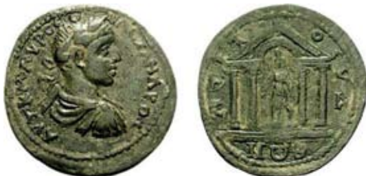
Мал. 6. Храм зі статуєю Серапіса на монеті з Аттуди (Карія) (за: https://bit.ly/3BIMQa3 )

Який вигляд мав храм зі статуєю Серапіса, можна дещо прояснити завдяки неопублікованій монеті часів Александра Севера з Аттуди в Карії ( мал. 6 ).