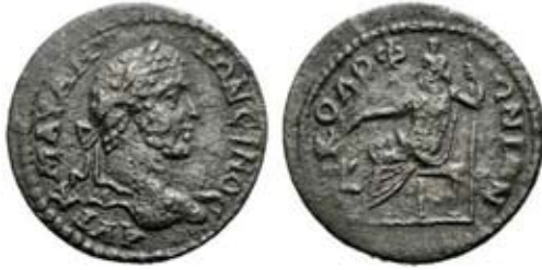
Мал. 3. Гадес-Серапіс із Кербером на монеті з погруддям імператора Каракалли з Колофона (Іонія) (за: [ВМС, 48])

У Лідії такі монети карбувалися в Траллах у часи Антоніна Пія [Mionnet, IV, 34] та у Феатирі в часи Марка Аврелія [GRPC Lydia, 199].