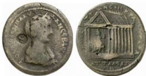
Мал. 5. Тетрастильний храм зі статуєю Серапіса на троні (за: [Fritz Rudolf Künker GmbH & Co. KGm, Auction 182, lot 800])

Який вигляд мав храм зі статуєю Серапіса, можна дещо прояснити завдяки неопублікованій монеті часів Александра Севера з Аттуди в Карії ( мал. 6 ).