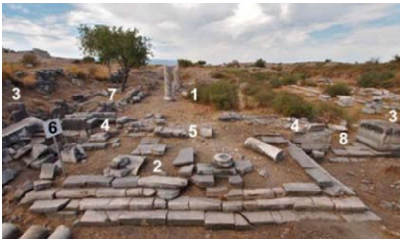
Мал. 1. Фото руїн Серапеему в Мілеті (за: [Niewöhner, Late Antiquity ])