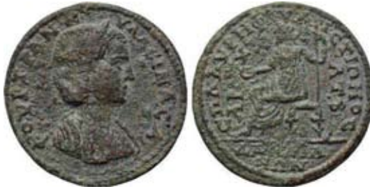
Мал. 8. Серапіс як Зевс із патерою в руках (за: [RPC IV, 203])

Цей самий образ міг використовуватися для представлення Гадеса-Серапіса як Зевса, коли в руці божества містилась патера, як на монеті з погруддям Транквіліни (241–244 рр. н. е.) з Далдіс-Флавіополіса в Лідії [RPC IV, 203] (мал. 8).