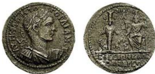
Мал. 16. Об'єднання культового зображення Артеміді Ефеської та Гадеса-Серапіса на троні з Кербером (за: [Franke, Noellé 1997, 554A])

В іншому випадку, на медальйоні з Ефеса з погруддям імператора Гордіана III, бачимо поєднання Серапіса-Гадеса, що традиційно сидить на троні, з Кербером біля ніг, і статуї Артеміді Ефеської, повернутих обличчями до споживача-глядача [Franke, Noellé 1997, 554A] (мал. 16). Слід підкреслити, що це практично поодинокий тип, де можна побачити спробу передати риси обличчя Серапіса анфас.