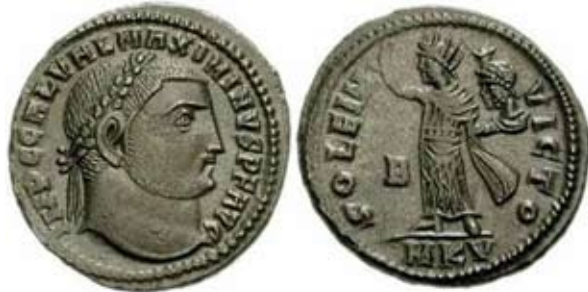
Мал. 18. Sol Invictus із погруддям Серапіса (за: [RIC VI Syzicus, 92])

Також у дуже невеликій кількості монет погруддя Серапіса було вміщено до рук іншого божества. Прикладом може правити монета з погруддям Максиміна II з Кизика, коли бюст Серапіса тримає Sol Invictus [RIC VI Syzicus, 92] (мал. 18).