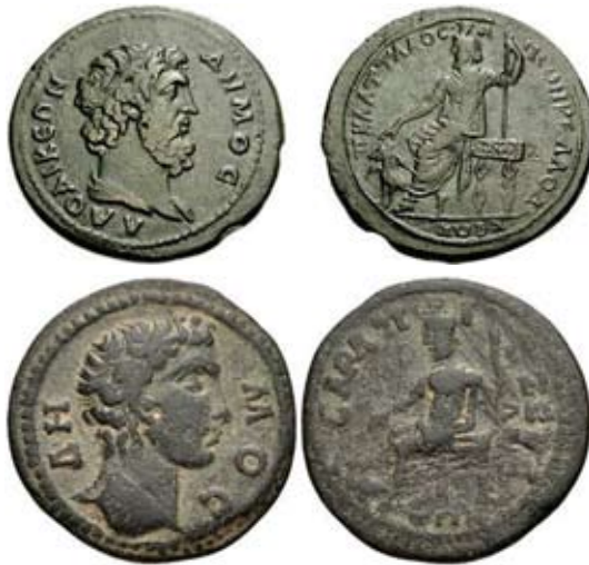
Мал. 9. Гадес-Серапіс на монеті з персоніфікацією демосу з фригійських Лаодікеї над Ліком та Кібіри (за: [Imhoof Blumer, 36])

Образ Серапіса на троні можемо побачити на монетах так званих псевдоавтономних, напівавтономних чи автономних випусків у поєднанні з персоніфікацією такого важливого для населення провінції символу, як демос. У часи Антоніна Пія в Лаодікеї у Фригії викарбувано велику за розміром монету з персоніфікацією демосу [Imhoof Blumer, 36] (мал. 9).