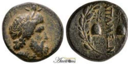
Мал. 14. Бюст Серапіса в короні Ісїди на монеті Апамеї (за: [SNG Cop., 160])

Завершуючи аналіз іконографії Серапіса та особливостей його місця в системі релігійного життя населення провінції Азії, хотілось би підкреслити цікаву особливість. Провінція була давнім центром пошанування Артемїди Ефеської, і, без сумніву, культова статуя богині була найбільш упізнаваним символом в античності. У монетному карбуванні регіону ця статуя теж часто використовувалася. Проте нумізматичні джерела також вказують, що були й інші регіональні, не менш значущі для міст культові зображення божеств. Наприклад, званою в регіоні (і цілком втраченою для нас) була культова статуя Кори, Ніке чи Артемїди Анаїти. Порівняно часто трапляються штампи, де “головний” бог тримає в руках культову статую меншого божества. Можна припустити, що магістрати в такий спосіб намагалися поєднати декілька культів чи через символи окреслити представників місцевого пантеону. Серапіса теж можна побачити в сюжетних композиціях “колективів” божеств та культових зображень. Без сумніву, першу групу таких монет становить поєднання постаті Серапіса, що стоїть зі списом, та статуї Артемїди Ефеської, яке представлено, наприклад, у карбуванні Іераполіса з погруддям імператора Валеріана [ВМС, 188] ( мал. 15 ).