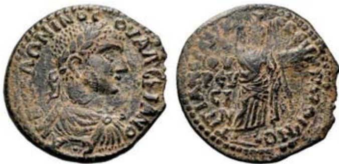
Мал. 11. Серапіс із жестом adlocutio на монеті з Теменофере (за: [ВМС, 38])