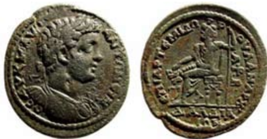
Мал. 7. Імператор Каракалла особливо часто вміщував на своїх монетах образ Серапіса (за: [GRPC Lydia, 42])

Погруддя ж самого Каракалли зобразили із Серапісом на троні та Кербером біля ніг на монетах міста Далдіс-Флавіюполіса в Лідії [GRPC Lydia, 42] ( мал. 7 ).