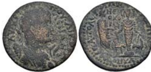
Мал. 15. Серапіс та статуя Артемїди Ефеської (за: [ВМС, 188])

Завершуючи аналіз іконографії Серапіса та особливостей його місця в системі релігійного життя населення провінції Азії, хотілось би підкреслити цікаву особливість. Провінція була давнім центром пошанування Артемїди Ефеської, і, без сумніву, культова статуя богині була найбільш упізнаваним символом в античності. У монетному карбуванні регіону ця статуя теж часто використовувалася. Проте нумізматичні джерела також вказують, що були й інші регіональні, не менш значущі для міст культові зображення божеств. Наприклад, званою в регіоні (і цілком втраченою для нас) була культова статуя Кори, Ніке чи Артемїди Анаїти. Порівняно часто трапляються штампи, де “головний” бог тримає в руках культову статую меншого божества. Можна припустити, що магістрати в такий спосіб намагалися поєднати декілька культів чи через символи окреслити представників місцевого пантеону. Серапіса теж можна побачити в сюжетних композиціях “колективів” божеств та культових зображень. Без сумніву, першу групу таких монет становить поєднання постаті Серапіса, що стоїть зі списом, та статуї Артемїди Ефеської, яке представлено, наприклад, у карбуванні Іераполіса з погруддям імператора Валеріана [ВМС, 188] ( мал. 15 ).