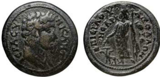
Мал. 10. Гадес-Серапіс на монеті з персоніфікацією сенату (за: [SNG Righetti, 1006])

У монетному карбуванні Гермокапелії в Лідії зображення Серапіса зі скіпетром та патерою в руках також вміщували на монетах із погруддям персоніфікації сенату [GRPC Lydia, 27], хоча найчастіше магістрати цього міста обирали богиню Рому для напівавтономного карбування.