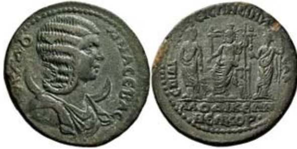
Мал. 17. Гадес-Серапіс в оточенні Ісиди та Тюхе на монеті з погруддям Юлії Домни (за: [Tkalec 1991, 330])

зображено Ісиду з лотосом на голові. Богиня тримає систрум і ситуту, обернувшись до Серапіса, який сидить ліворуч із калафом на голові. Бог тримає скіпетр, біля ніг праворуч від Серапіса сидить Кербер. Ліворуч від Серапіса стоїть Геката-Селена з півмісяцем на голові, тримаючи в руках мак та факел, і дивиться на Серапіса. Легенда називає магістрата та факт неокорату: ΕΠΙ ΑΙΛ ΠΕΙΣΩΝΕΙΝΗΣ ΑΡ ΛΑΟΔΙΚΕΩΝ ΝΕΩΚΟΡ [Münzauktion Tkalec 1991, 330] (мал. 17).