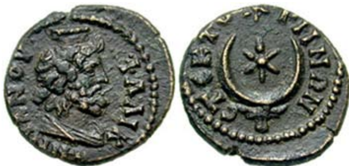
Мал. 13. Символіка єгипетських божеств на монетах зі Стекторіума (за: [ВМС, 2])

На зворотному боці монети напівавтономного карбування зі Стекторіума у Фригії (161–180 рр. н. е.) через поєднання голови корови з рогами у вигляді півмісяця і зірки між ними легко впізнається персоніфікація Ісиди [ВМС, 2] (мал. 13).