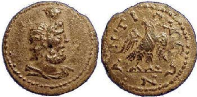
Мал. 12. Поєднання погруддя Серапіса та орла з розправленими крилами (за: [Paris, 133])

Погруддя Серапіса на аверсі мало усталену іконографію, і такі монети загалом становлять третю групу відомих зразків. Навколо бюста божества ніколи немає пояснювальної легенди, але Серапіс добре ідентифікується завдяки традиційному головному убору у вигляді модія чи полоса. Якщо придивитись уважно, то впадає у вічі те, що на монетах, на відміну від скульптурних чи інших зображень, майже завжди Серапіса зображували в профіль. Така особливість пояснювалася спрощенням процедури виготовлення монетного штампа, що було важливо для віддалених регіонів. Подібно до погруддя імператорів, щодо монет не існувало чіткого визначення, у який бік має бути повернутий бюст. Оскільки монети датуються переважно кінцем II–III ст. н. е., то часто на їхньому зворотному боці можна побачити богиню Тюхе, чия іконографія в цей період була особливо популярною. На території провінції Азії подібні монети походять із Саїтти в Лідії [ВМС, 33]. Однак цей тип не був переважним, адже в інших містах можна побачити поєднання погруддя Серапіса із зображеннями Афіни, Асклепія, Артеміди-Гекати, як, наприклад, у карбуванні Феатири, чи Гермеса, як у Триполісі або в Гіргалі, Геракла в Аморіумі, Марсіаса чи річкового бога у фригійській Апамеї, річкового бога на зворотному боці монет з Евменії у Фригії, Діоніса на монетах з Фемісоніума (Фригія) і навіть самого Зевса, як у Єраполісі. Бюст Серапіса, як не дивно, був уміщений і на реверсі монети імператорського карбування часів Гордіана III в