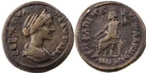
Мал. 4. Гадес-Серапіс із Кербером на троні на монеті з Акмонеї (за: [SNG Tuebingen, 3920])

У Фригії лише невелике місто Акмонея викарбувало у 202–205 рр. н. е. монету з погруддям дружини імператора Каракалли Фульвії Плавцілли та Серапісом в іпостасі Гадеса на троні [SNG Tuebingen, 3920] ( мал. 4 ). Монета цікава передусім легендою навколо погруддя дружини Каракалли – ПЛАУТИЛЛА СЕБАСТА.