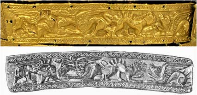
Мал. 2. Пластина з кургану Товста Могила (промальовка за [Мозолевський 1979, 130, рис. 111])

Загалом композиційна побудова декору жіночого головного убору з Товстої Могили є традиційною для середини – третьої чверті IV ст. до н. е. [Ростовцев, Степанов 1917; Боровка 1921; Мирошина 1980; Клочко, Васіна 2011; Бабенко 2002; 2021; ін.]. Щонайменше в 14 випадках у декорі використано нижню стрічку-метопіду з рослинним візерунком, у 9 – довгі пластинки із зображенням протиставлених сфінкса та грифона. А ось пластини зі сценами шматування і протистояння є рідкісними і зустрі-