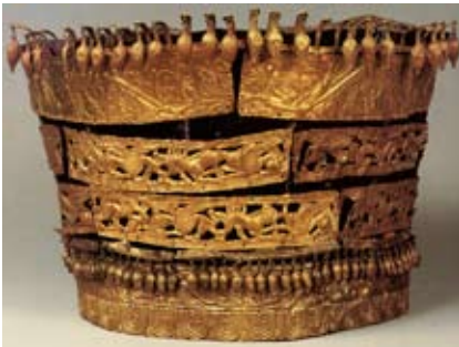
Мал. 3. Жіночий головний убір з кургану Чортотлик

Загалом композиційна побудова декору жіночого головного убору з Товстої Могили є традиційною для середини – третьої чверті IV ст. до н. е. [Ростовцев, Степанов 1917; Боровка 1921; Мирошина 1980; Клочко, Васіна 2011; Бабенко 2002; 2021; ін.]. Щонайменше в 14 випадках у декорі використано нижню стрічку-метопіду з рослинним візерунком, у 9 – довгі пластинки із зображенням протиставлених сфінкса та грифона. А ось пластини зі сценами шматування і протистояння є рідкісними і зустрі-