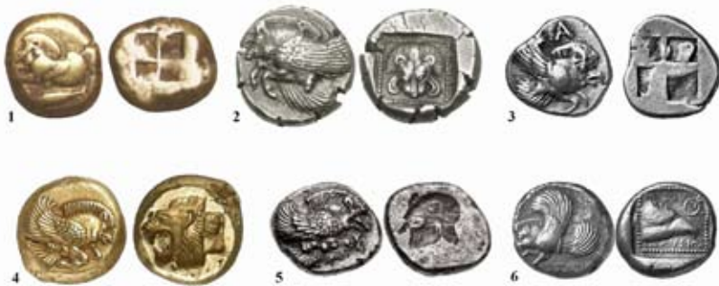
Мал. 5. Монети із зображенням протоми крилатого кабана: 1 – Кізік (550–475 р. до н. е.); 2 – Самос (526–522, 510–500 р. до н. е.); 3 – Клазомени (V ст. до н. е.); 4 – Лесбос (550–450 р. до н. е.); 5 – Лесбос (V ст. до н. е.); 6 – Родос (500–408 р. до н. е.) (фото за [Шергина 2011, рис. 4, 5, 8, 9, 10, 14])

Поява цих монет, ймовірно, пов'язана з подіями середини VI ст. до н. е.: поразкою Креза і захопленням персами Лідійського царства в 547 р. до н. е., провалом антиперського повстання Пактія і, зрештою, з остаточним завоюванням персами Іонії в 546 р. до н. е. [Дандамаев 1985, 19–27]. Грецькі міста увійшли до складу перських сатрапій і не тільки платили податки, а й мали виконувати військову повинність, зокрема надавати персам військовий флот [Дандамаев 1985, 26–27]. Це втягнуло в орбіту персів й егейські острови. Іонійське повстання 499–493 рр. до н. е., греко-перські війни, що розпочалися після нього та завершилися битвою біля мису Мікале в 479 р. до н. е. [Дандамаев 1985, 112–170], сприяли вивільненню Іонії від прямої залежності від держави Ахеменідів. Проте перський фактор завжди залишався чинним в історії та культурі грецьких міст. Виявився він, зокрема, і в оформленні монет [Рунг 2008, 33].