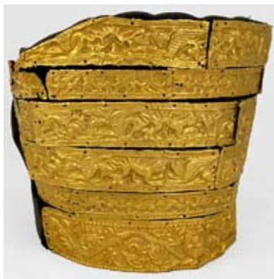
Мал. 1. Жіночий головний убір з кургану Товста Могила

Б. М. Мозолевського [Мозолевський 1979, рис. 133, а–в; 134 ] 1 , головний убір був у формі перевернутого зрізаного конуса. Більш висока чільна сторона та боки були оздоблені довгими золотими пластинами зі штампованими зображеннями 2 . Нижню частину огортала метопіда (пластина-стрічка довжиною 32,5 см і шириною 4 см) із зображенням рослинного орнаменту “на мотив аканфового пагона” [Мозолевський 1979, 127]. Над нею здіймалися п’ять фризів, кожен з яких складався довгими пластинками. Перший і четвертий фризи утворюють вузькі пластини (три цілих розмірами 13,0 × 2,0–2,2 см, п’ять обрізків різних розмірів) із зображеннями пари істот – “сфінкса” та грифона, які стоять. Вони підняли ліві передні лапи і з’єднали їх над невеликим деревцем. Пари на кожній пластині повторюються двічі, на краях пластин розташовані поодинокі фігури істот, які утворюють наступну пару при зіставленні з іншою пластиною (мал. 1). Другий, третій та п’ятий, завершальний, фризи складені з більш широких пластинок (їх шість цілих розмірами 16,2–16,4 × 3,1–3,3 см та шістьнадцять фрагментів). На кожній з них розміщено по дві сцени: ліворуч зображено двох грифонів, які шматують оленя. Праворуч цієї сцени відтворено сцену протистояння лева фантастичній істоті, що має голову та передні ноги вепра, гнучке тіло лева та пташині крила (мал. 1, 2).