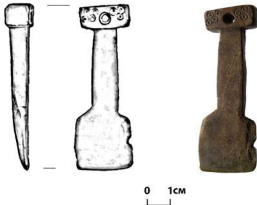
Мал. 7. Частина кістяного безміна з розкопок Чернігова 2006 р.

У зв'язку з цим можна згадати ще одну рідкісну для Південної Русі річ, виявлену під час археологічних досліджень чернігівської фортеці-дитинця у 2006 р. (мал. 1: С). Це частина золотоординського безміна (терезів) з кістки (мал. 7).