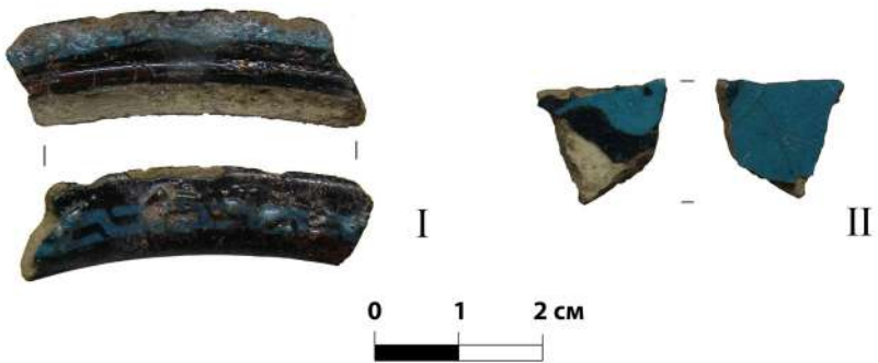
Мал. 4. Фрагменти посуду з напівфаянсу з чорним та блакитним розписом з розкопок 2018 р.

Утім є і рідкісні винятки, які дають змогу говорити про більш вузьке датування. До них можна віднести, наприклад, знахідку фрагментів східної полив'яної кераміки під час науково-рятивних археологічних досліджень 2018 р. на території т. зв. “Окольного граду” по вул. Мстиславській, 28А [Черненко, Новик, Жаров 2020] ( мал. 1: В ). Це два фрагменти (осколки вінця та стінки) чаші (чаш?) з напівфаянсу (білого дрібнопористого кашину), декорованого чорним та блакитним розписом ( мал. 4 ). Вінця чаші мають характерне рейкоподібне потовщення, що дає підстави визначити її належність до тієї групи посуду, яка має аналоги серед кераміки Ірану кінця XIII–XIV ст. Вважається, що подібний посуд потрапляє до Східної Європи внаслідок розвитку східного напрямку торгівлі за часів Золотої Орди [Коваль 2003, 369, рис. XVI: 3, 4 ].