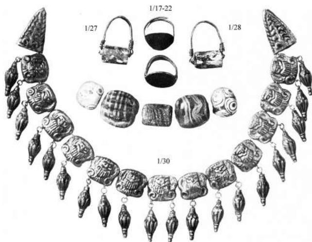
Мал. 4. Фотографія знахідок із Першого Мордвинівського кургану (за [Лесков 1974, рис. 40 ]) із зазначенням облікових номерів інвентарної книги Державного Ермітажу