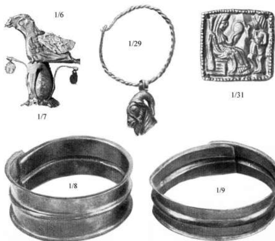
Мал. 5. Фотографія знахідок із Першого Мордвинівського кургану (за [Лесков 1974, рис. 37, 39, 41, 42 ]) із зазначенням облікових номерів інвентарної книги Державного Ермітажу (без масштабу)