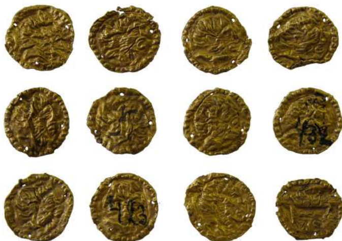
Мал. 1. Пластинки із зображенням бородатої чоловічої голови в профіль вправо.