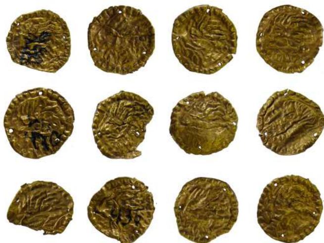
Мал. 2. Пластинки із зображенням бородатої чоловічої голови в профіль вліво.