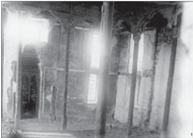
Іл. 2. Ешиль-Джамі. Внутрішня арка з розписом і міхраб.