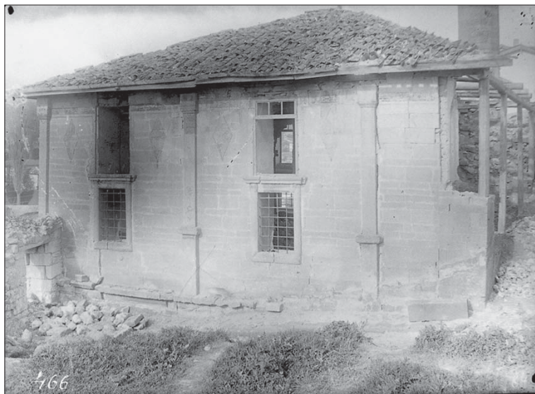
Іл. 7. Ешиль-Джамі. Західна стіна мечеті.