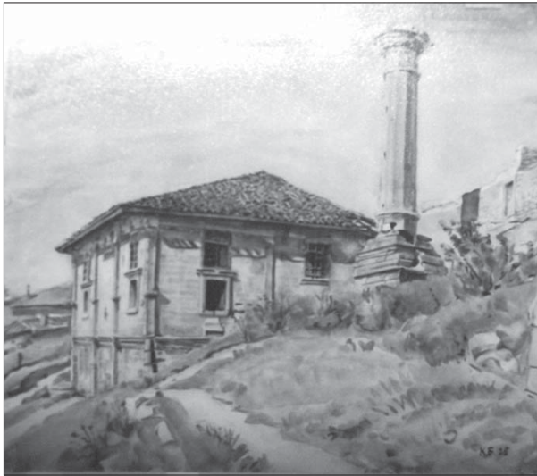
Іл. 1. Акварель К. Ф. Богаєвського. Ешиль-Джамі. З фондів БІКЗ.