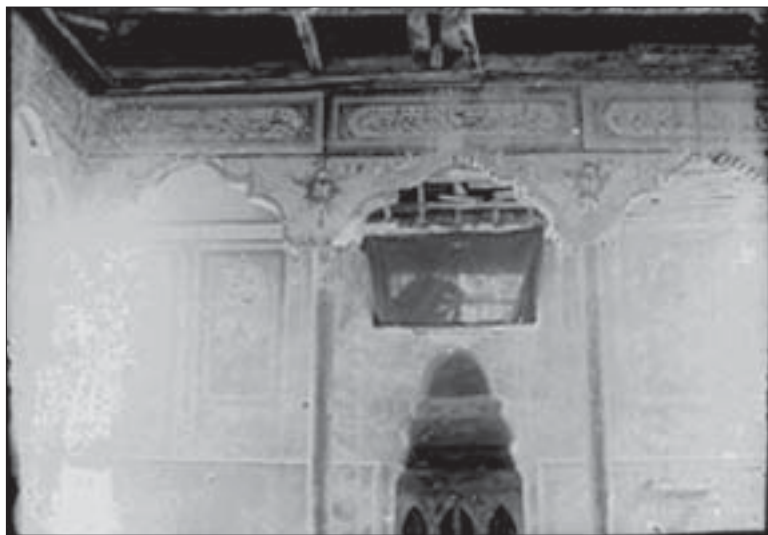
Іл. 4. Ешиль-Джамі. Розпис аркади всередині.