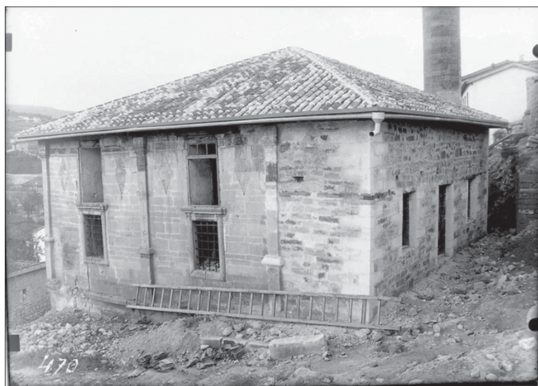
Іл. 8. Ешиль-Джамі. Загальний вигляд зі сходу. З фондів БІКЗ.