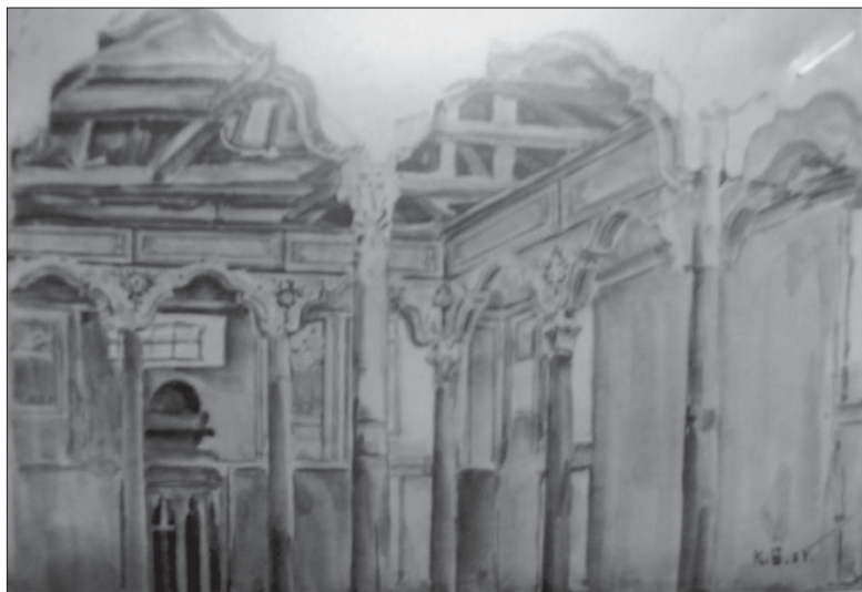
Іл. 3. Акварель К. Ф. Богаєвського. Внутрішній вигляд Ешиль-Джамі.