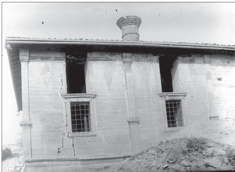
Іл. 5. Ешил-Джамі. Південно-західна стіна до розкопок. З фондів БІКЗ.