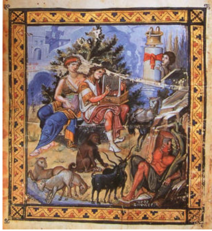
Мал. 2. Зображення царя Давида на мініатюрі Паризького Псалтиря (gr. 139)

У центральних закомарах північного, південного та західного фасадів церкви Покрова на Нерлі розташовано три однакові композиції з різного каменю – це зображення царя Давида на троні в оточенні парних скульптур левів та голубів. Зверху над кожним з рельєфів міститься напис “СТЪ Д [А] В [И] ДЪ”, що означає “Святий Давид”. Цар постає в образі юнака, який урочисто сидить на престолі (мал. 3). Правою рукою він благословляє, а лівою притискає до тулуба прямокутний п’ятиструнний музичний інструмент, подібний до давньогрецького псалтерія вертикального тримання.