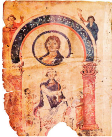
Мал. 1. Зображення царя Давида на мініатюрі Хлудівського Псалтиря (греч. 129-д) (за: [Лихачева 1977, 26])

У Паризькому Псалтирі (гг. 139) 2 , що датується різними авторами в діапазоні від середини IX ст. [Лазарев 1986, 69] до першої половини X ст. [Даркевич 1975, 132], на одній з мініатюр зображено царя Давида, що грає на струнному інструменті (мал. 2). Поруч із ним розташувалися невелика отара овець та собака. За його спиною сидить жінка, поруч із якою написано “МЕЛОДІА”. Однозначно класифікувати інструмент у руках царя Давида неможливо. В. Петров називає його десятиструнною лірою, що являє собою прямокутну раму зі струнами. Також дослідник відзначає, що сама ліра має коробку-резонатор, щодо якої вона розміщена неначе кришка рояля. Між лірою та коробкою наявна підпірка, яку Давид тримає лівою рукою [Петров 2010, 700]. Однак однозначно погодитися з цими висновками В. Петрова не можна. На зображенні