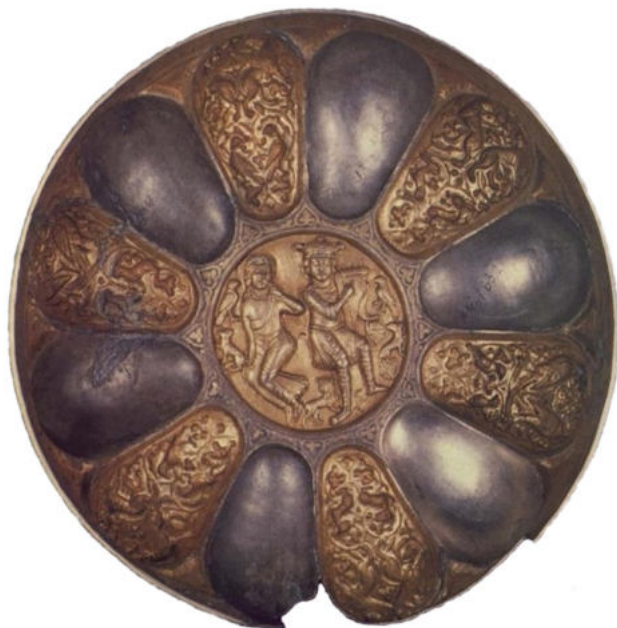
Мал. 8. Срібна чаша зі знахідок 1957 р. в Чернігові (за: [Даркевич 1975, 18])

Проаналізувавши детально зовнішній вигляд персонажів на зображенні та загальну композицію, В. Даркевич висунув гіпотезу, що на чаші зображено не Давида та Мелодію, а інші відомі в середньовічному мистецтві постаті – Дигеніса та Євдокію [Даркевич 1975, 135]. Про це, на його думку, свідчить кардинальна зміна зовнішнього вигляду головних героїв – легке драпування змінено одягом середньовічного крою, античну ліру в руках витіснила середньовічна арфа, відсутні німби, а отара овець та кіз, що мирно випасається поруч, замінена левами, вовками та зайцями. Все це надає зображенню, на погляд дослідника, світський колорит, і в такий спосіб образ молодого біблійного пастуха, що “випасає овець батька свого”, перетворюється на епічного героя [Даркевич 1975, 133]. В. Даркевич порівнює зображення на чаші з поемою про Дигеніса Акрита, знаходить низку збігів і засвідчує його більшу схожість із постатями Дигеніса та Євдокії [Даркевич 1975, 135–139].