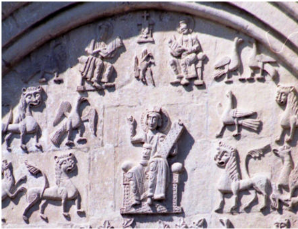
Мал. 4. Зображення царя Давида на рельєфі Дмитріївського собору у Володимирі

У трьох центральних тимпанах фасадів – західного, східного та південного – Дмитріївського собору у Володимирі також вміщена персоніфікована фігура молодого царя-пророка на троні (мал. 4). Юнака оточують птахи, леви та грифони, що тримають ланей у лапах. У 1998–1999 рр. під час реставрації рельєфного зображення на південному фасаді храму було виявлено напис “АГ ДДД”, що засвідчило: особа на рельєфах – справді саме цар Давид [Новаковская-Бухман 2002, 174].