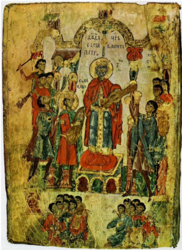
Мал. 6. Зображення царя Давида на мініатюрі Хлудівського (Симоновського) Псалтиря (Хлуд. 3) (за: [Porova 1975, 55])

Найімовірніше, зображений на мініатюрі Хлудівського Псалтиря музичний інструмент є гудком – інструментом, що побутував у Середньовіччі у Східній Європі. Знахідки гудків та їхніх фрагментів різного ступеня збереженості, що зафіксовані в цьому регіоні, датуються XI – другою половиною XIV ст. [Колчин 1968, 67]. Назву “гудок” мав смичковий інструмент із корпусом овальної форми без бічних виїмок. На інструменті був відсутній спеціальний гриф. На верхній деці іноді зустрічалися резонансні отвори у вигляді напівкруглих дужок, однак у більшості випадків вони відсутні. Під час гри гудок тримали у вертикальному