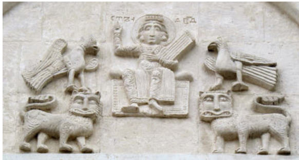
Мал. 3. Зображення царя Давида на рельєфі церкви Покрова на Нерлі (за: https://bit.ly/2Ss1rsN )

У центральних закомарах північного, південного та західного фасадів церкви Покрова на Нерлі розташовано три однакові композиції з різного каменю – це зображення царя Давида на троні в оточенні парних скульптур левів та голубів. Зверху над кожним з рельєфів міститься напис “СТЪ Д [А] В [И] ДЪ”, що означає “Святий Давид”. Цар постає в образі юнака, який урочисто сидить на престолі (мал. 3). Правою рукою він благословляє, а лівою притискає до тулуба прямокутний п’ятиструнний музичний інструмент, подібний до давньогрецького псалтерія вертикального тримання.