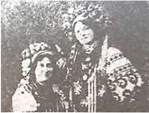
Мал. 4. Актори трупи Каменського у вишиванках (за [Kobe Yuushin 1916a, 6])