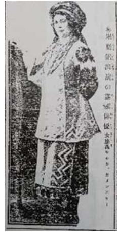
Мал. 5. Зірка Каменська (за [Kobe Yuushin 1916a, 5])

28 травня в одній із газет Кобе було надруковано оголошення про закриття сезону вистав гастролуючої української трупи. Звідси розуміємо, що йдеться про завершення сезону вистав у місті Кобе. Проте в наступному газетному оголошенні ( мал. 6 ), повідомлялося, що після офіційного закриття сезону протягом наступних двох днів, 29 та 30 травня, було проведено ще декілька додаткових спектаклів 13 , а саме: ставили оперу “Запорожець за Дунаєм”, та “Воскресіння”, за мотивами роману Льва Толстого. Перший твір був написаний українським композитором Семеном Гулаком-Артемовським, життя і творчість якого припадають на XIX ст. 14 . А під час першої інсценізації другого твору, роману “Воскресіння”, відома японська акторка та співачка Мацуї Сумако, про яку ми вже згадували раніше, виконала “Пісню Катюші”, яка завдяки чудовому виконанню стала найпопулярнішою, у той час, пісню в Японії. У коментарі також вказувалося, що при написанні “Пісні Катюші” було використано пентатоніку, музичний лад, притаманний японській традиційній музиці. Авторами тексту пісні були: Шімамура Хогецу та Їофу Сома, а композито-